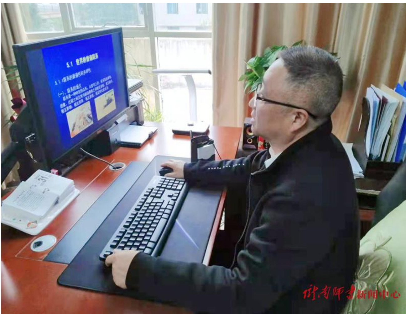
(图：马勤学教授讲述防疫哲学)