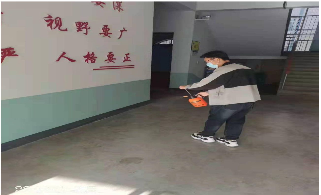
(图：学院安排专人负责日常消杀)

自线上教学开启之日，学院安排专人负责教室及办公区域日常消杀，为恢复线下教学做准备。