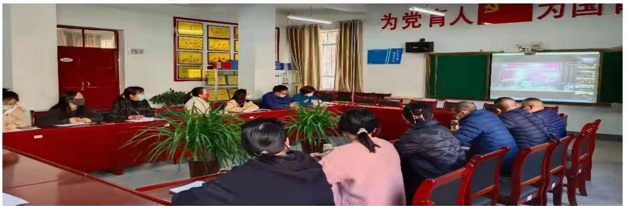
(图：3月14日，学院紧急召开线上教学部署会议，并组织全院教师参加线上教学技能培训)